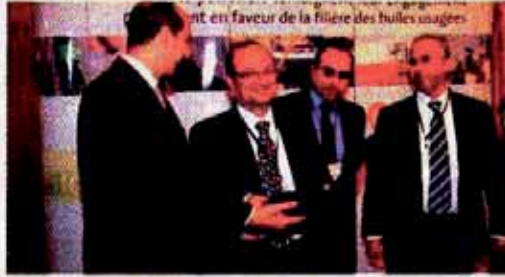
مسؤولو شركات المترول يتلقون «جوائز الالتزام في التنمية المستدامة» (ك.فزازي)