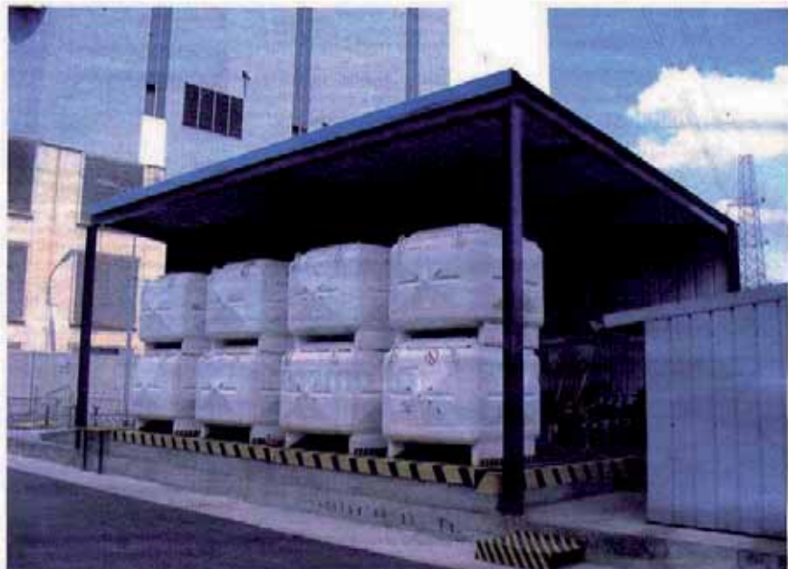
Un des soucis majeurs derrière l'amplification de ces opérations de collectes est la protection de l'environnement. Pour preuve, un litre d'huile usagée peut contaminer 1.000 m 3 d'eau.